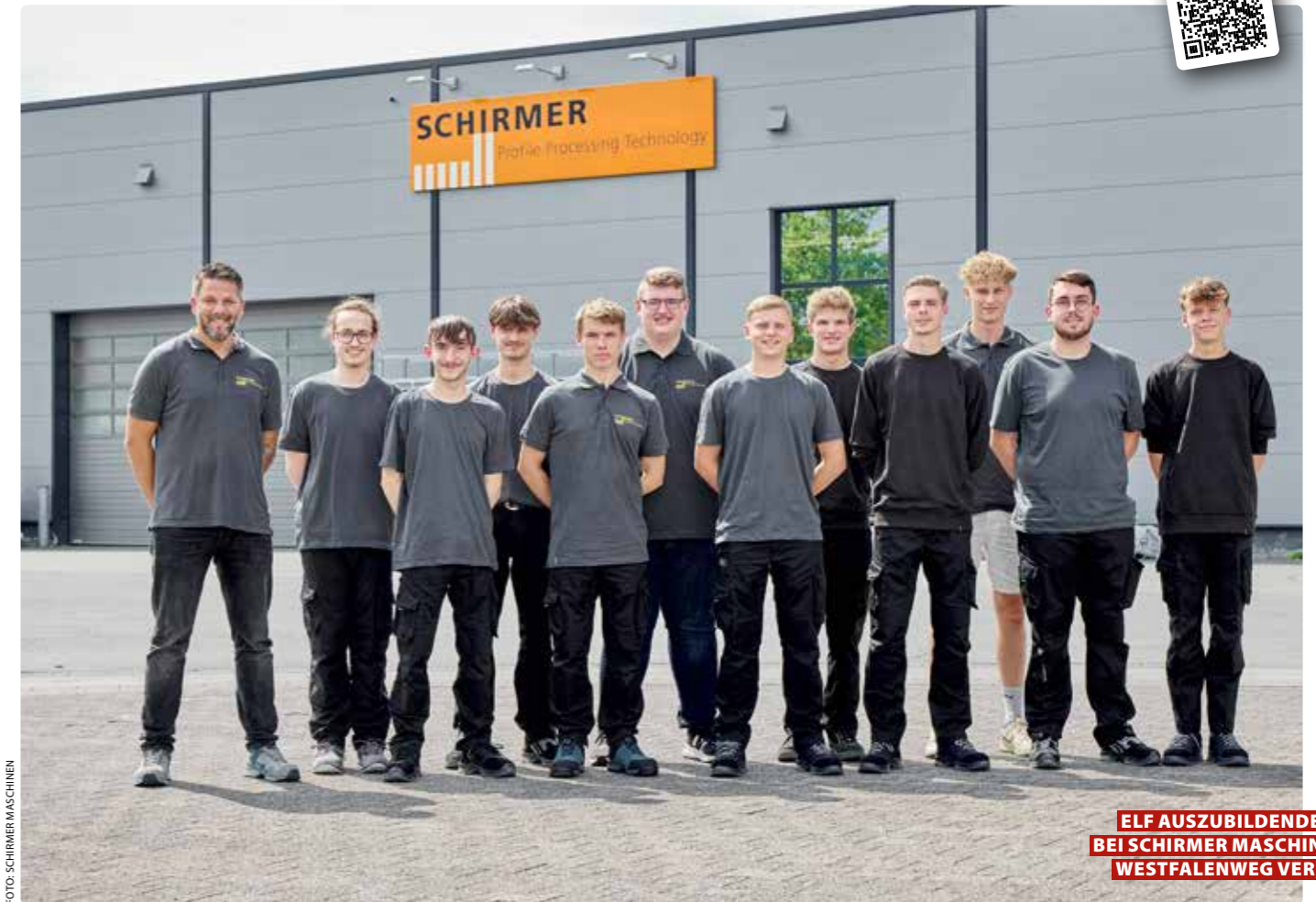
ELF AUSZUBILDENDE BEI SCHIRMER MASCHINEN WESTFALENWEG VERL