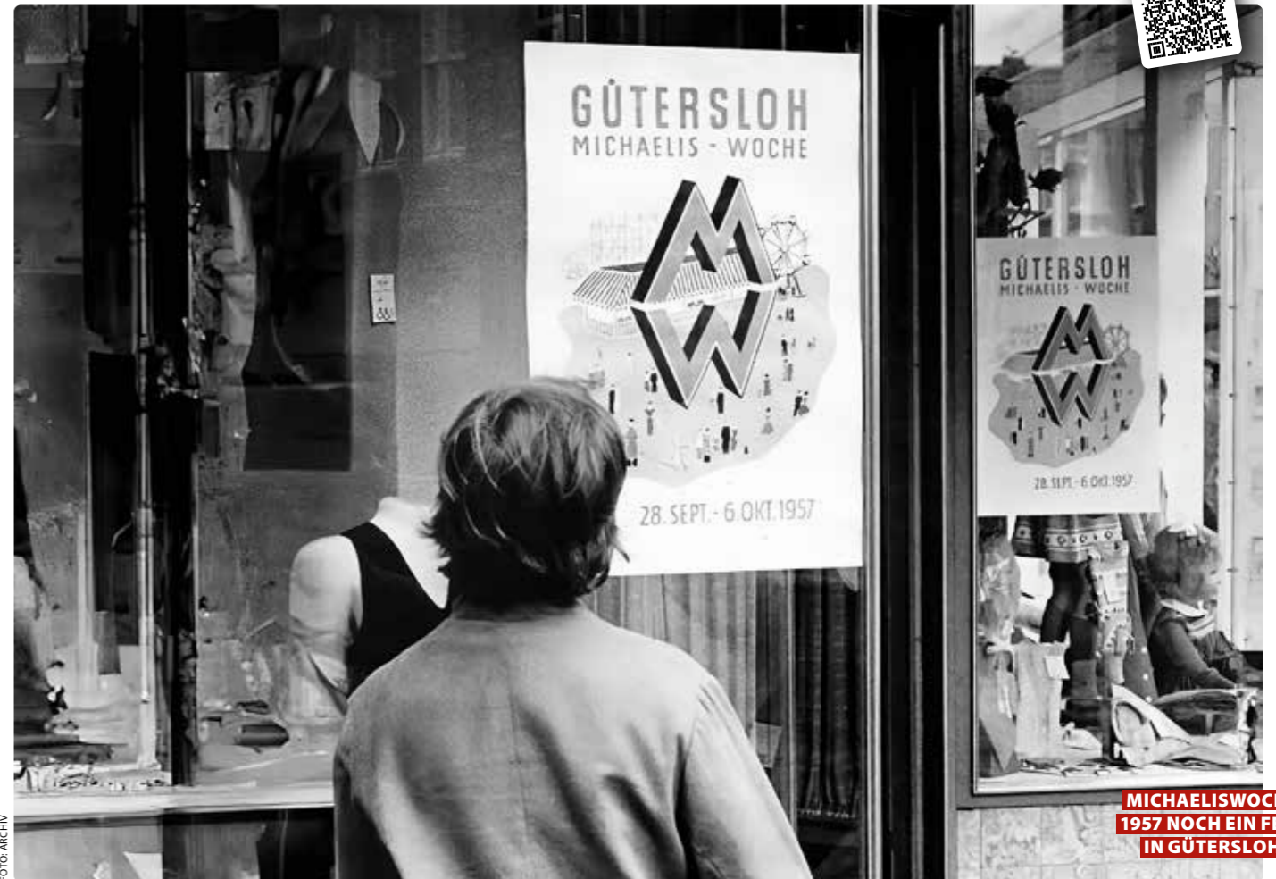
MICHAELISWOCHE 1957 NOCH EIN FEST IN GÜTERSLOH