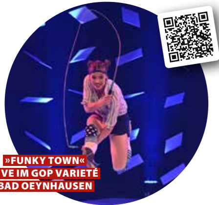
»FUNKY TOWN« LIVE IM GOP VARIETÉ BAD OEYNHAUSEN

Bei der Herbstshow im GOP Varieté Theater Bad Oeynhausen hält es das Publikum garantiert nicht auf den Stühlen, denn die Show widmet sich voll und ganz der groovigen Musik. Funk inspiriert Generationen, erreicht die Seele und prägt überall auf der Welt ein urbanes Lebensgefühl. Ob als jazziger Soul Pop in den USA, als Discosound der 80er oder als Hip Hop und House Music: Funk begeistert, Funk bewegt. Wenn sich dieser Groove mit moderner Weltklasse Akrobatik paart, dann brennt endgültig die Luft. Diese Show erfüllt die Zuschauer von Kopf bis Zeh mit Musik.