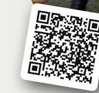
»EDELWEISS« KNEIPENMEILE IN GÜTSEL