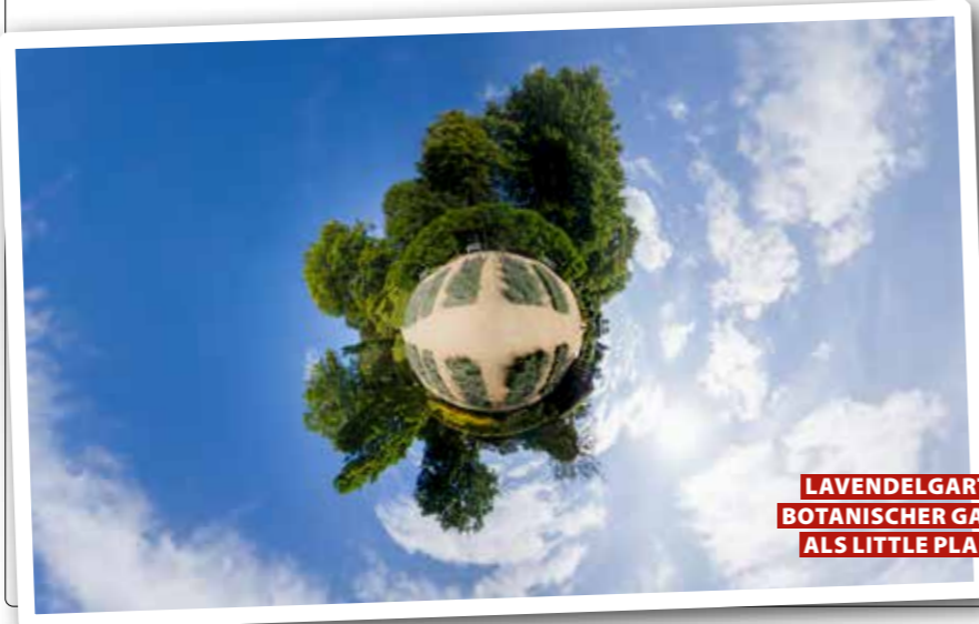
LAVENDELGARTEN BOTANISCHER GARTEN ALS LITTLE PLANET

ein interaktives 360-Grad-Panorama des Lavendelgartens verfügbar. Weitere Panoramen sind in Vorbereitung als ein Teil der Digitalisierungsstrategie. Panoramen für Gütersloher Unternehmen können online angefordert werden.