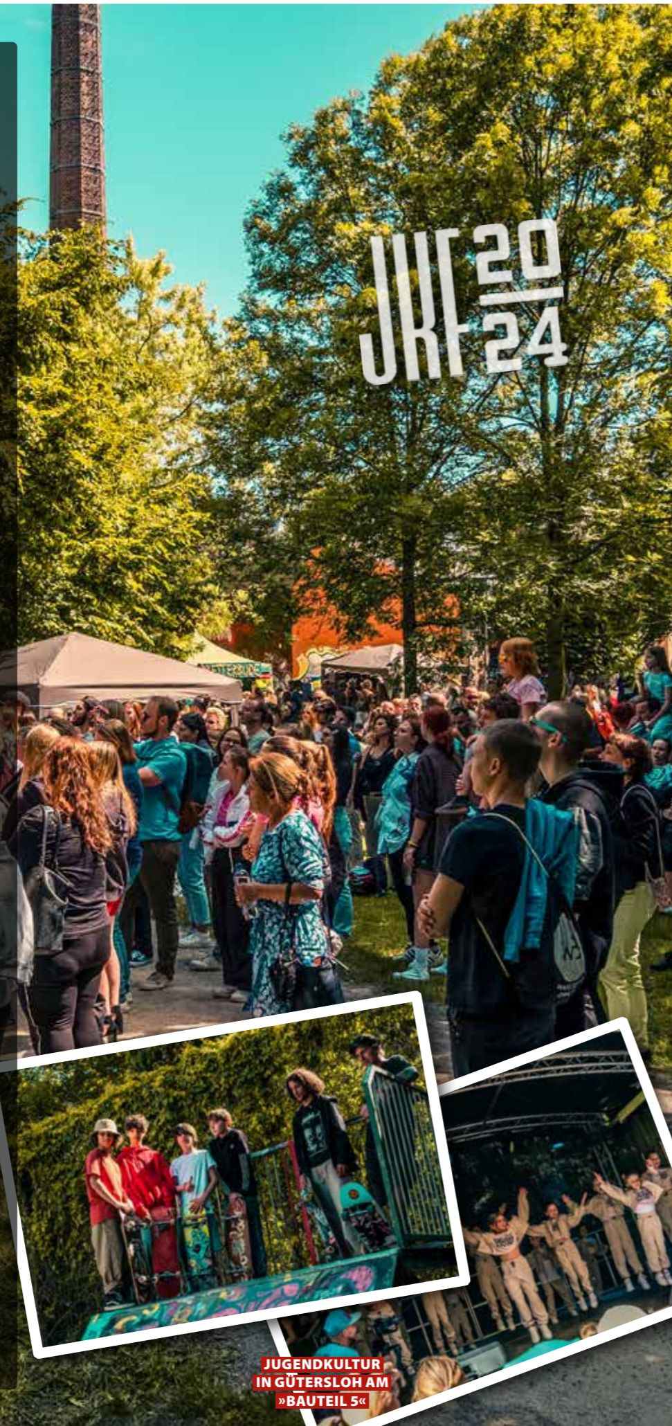
JUGENDKULTUR IN GÜTERSLOH AM »BAUTEIL 5«