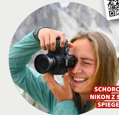
SCHORCHTIPP NIKON Z 50 BODY SPIEGELLOS