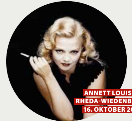
ANNETT LOUISAN RHEDA-WIEDENBRÜCK 16. OKTOBER 2024