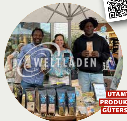
UTAMTSI PRODUKTE IN GÜTERSLOH