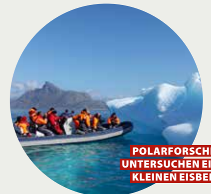
POLARFORSCHER UNTERSUCHEN EINEN KLEINEN EISBERG

Naturschutzteam Gütersloh, der HYLÄ in Gütersloh, Crossnight, Soroptimistinnen, Wilhalm Harzewinkel, Wiesenbad Bielefeld, Kino-Charts, Lesetipps, Flora-Charts, Schorchtipps, Go Green Challenge, Kinderklimawoche, The Joni Project in der Apostelkirche, Lavendelgarten