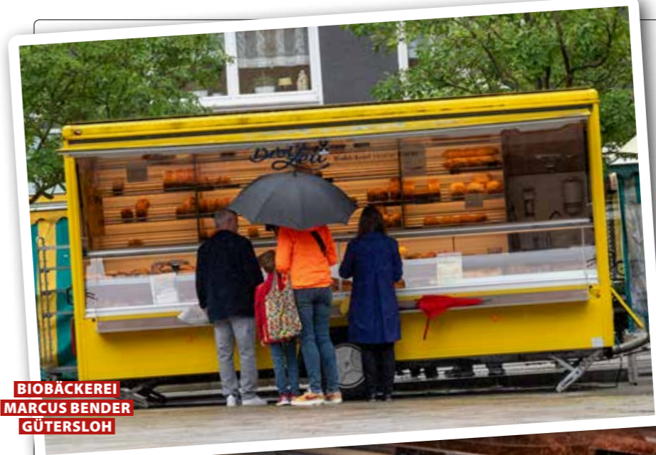
BIOBÄCKEREI MARCUS BENDER GÜTERSLOH

Hochbau • Tiefbau • Klinker • Garten • Holz • Innenausbau • Bauelemente • Bedachung • Fachmarkt