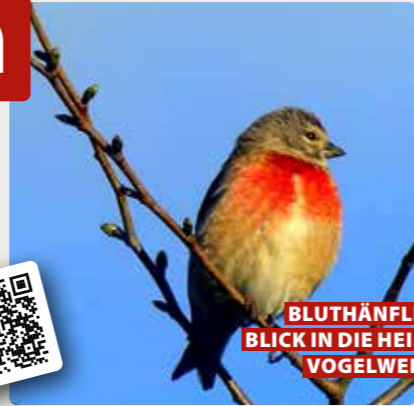
BLUTHÄNFLING BLICK IN DIE HEIMISCHE VOGELWELT

Das »Edelweiss« an der Stadthalle hat bei der Gründung von dem Förderprogramm profitiert. Die Stadtverwaltung unterstützt einige neue Konzepte, Geschäftsideen und Angebote mit dem Ziel, die Innenstadt zu beleben, denn ihr sind neue Fördermittel aus dem NRW-Programm »Zukunftsfähige Innenstädte und Ortszentren« bewilligt worden. Mithilfe der Fördergelder können Ladenlokale von der Stadtverwaltung vorübergehend angemietet und für bis zu zwei Jahre deutlich günstiger an beispielsweise Gründer mit vermeintlich spannenden, neuen und frequenzbringenden Konzepten im Bereich Handel, Gastronomie, Dienstleistung und Kultur weitervermietet werden. Gründe für den Umbruch in der Innenstadt glaubt man zu kennen: unter anderem der Onlinehandel und die »Corona-Folgeerscheinungen«.