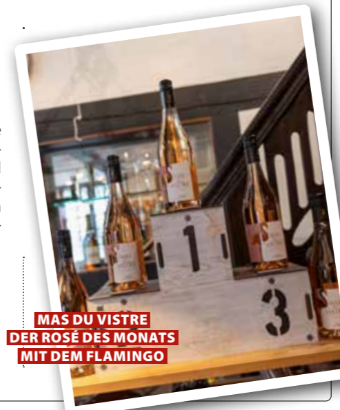
MAS DU VISTRE DER ROSÉ DES MONATS MIT DEM FLAMINGO

Weintipps des Monats von Dieter Strothenke, zu bekommen beim Weinhaus, Daltropstraße 2, Gütersloh, das-weinhaus-guetersloh.de