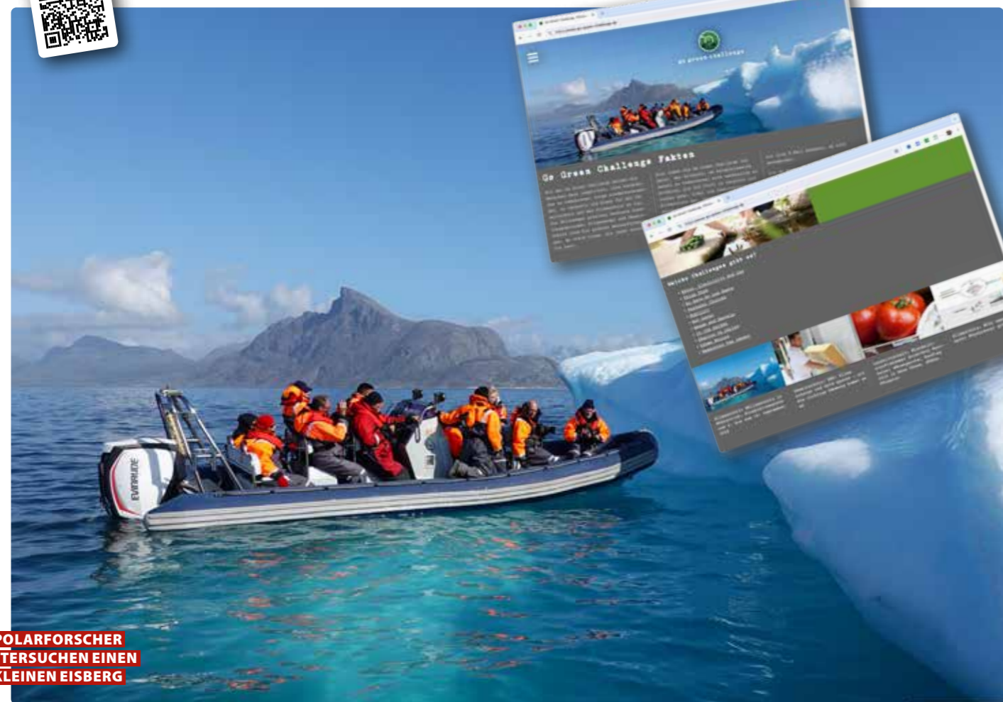
POLARFORSCHER UNTERSUCHEN EINEN KLEINEN EISBERG