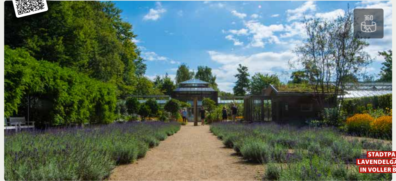
STADTPARK LAVENDELGARTEN IN VOLLER BLÜTE