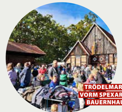
TRÖDELMARKT VORM SPEXARDER BAUERNHAUS