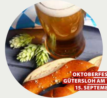
OKTOBERFEST IN GÜTERSLOH AM 14. UND 15. SEPTEMBER